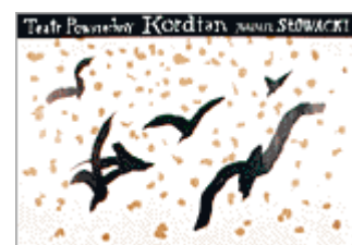
« Kordian » de Juliusz Slowacki Théâtre universel 1980