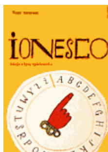
« Une leçon - La cantatrice chauve » d'Eugène Ionesco Théâtre Atheneum. 1966