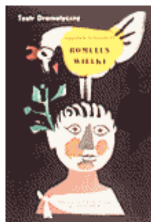
« Romulus le Grand » de Friedrich Dürrenmatt Théâtre dramatique 1959