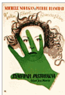
« La Symphonie pastorale » de Jean Delannoy 1947