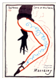
« Mannequins » de Zbigniew Rudzinski Opéra national de Wroclaw 1985