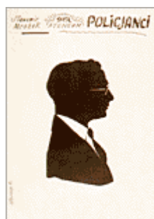
« Les Policiers » de Slawomir Mrozek Théâtre Atheneum. 1981