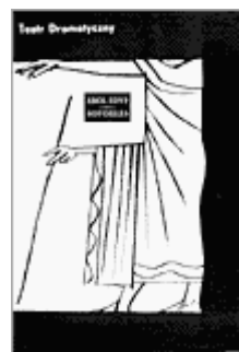
« OEdipe roi » de Sophocle « Théâtre dramatique 1961