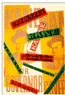
« Citizen Kane » d'Orson Welles 1948