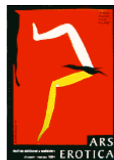
« Ars Erotica » Musée national de Varsovie 1994