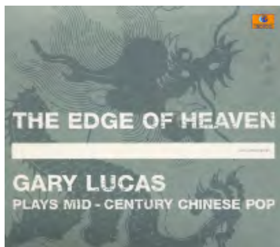
Gary Lucas. The edge of heaven. > fourreau