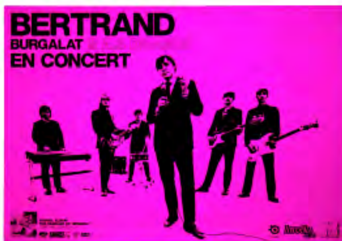
affiche 80 x 120 cm. Impression noir sur papier affiche fluo.