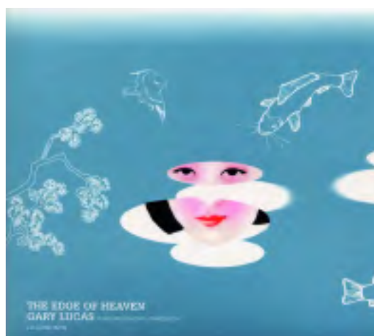
> couverture CD