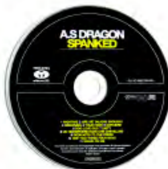
A.S. Dragon. Spanked. CD pour la presse