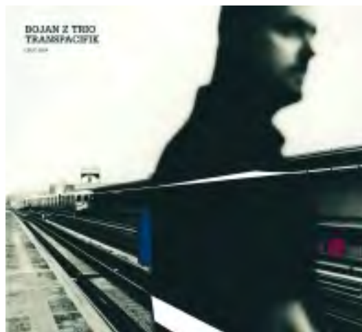
> couverture CD